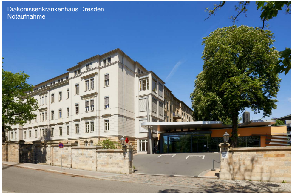
Diakonissenkrankenhaus Dresden Notaufnahme

Die Diakonissenhauskirche ist das älteste Nagelkreuzzentrum in Dresden. Die Kirche und das Krankenhaus wurden 1945 beim Bomben-Angriff auf Dresden von englischen und amerikanischen Fliegern zerstört. Ab 1965 kamen 100 junge Menschen ausgesendet aus Coventry in England, um gemeinsam mit jungen Deutschen das Diakonissenkrankenhaus wiederaufzubauen. Die Jugendlichen wollten damit ein Zeichen der Versöhnung setzen. Denn bereits 1940 hatten deutsche Bomber die Stadt Coventry zerstört. Viele der englischen und